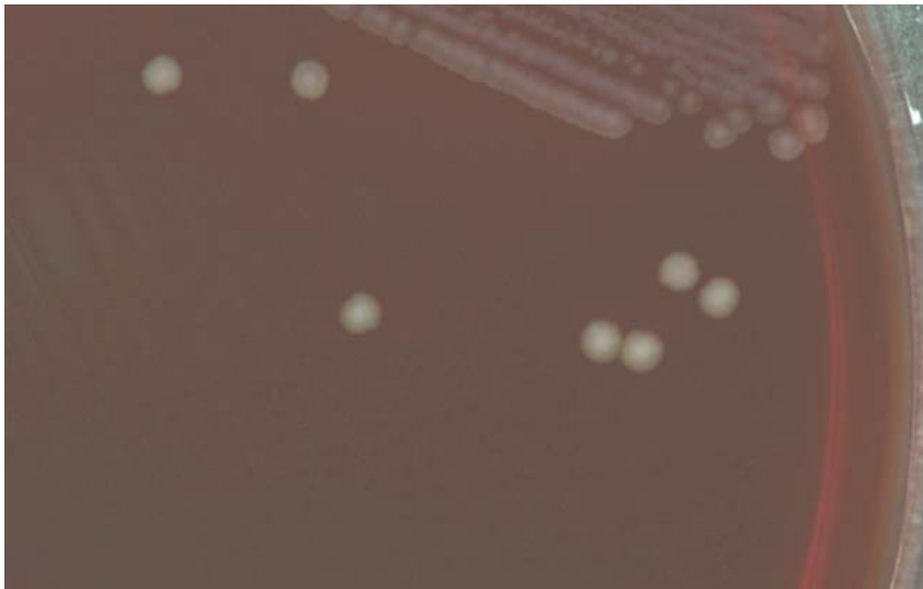
■ Campylobacter coli